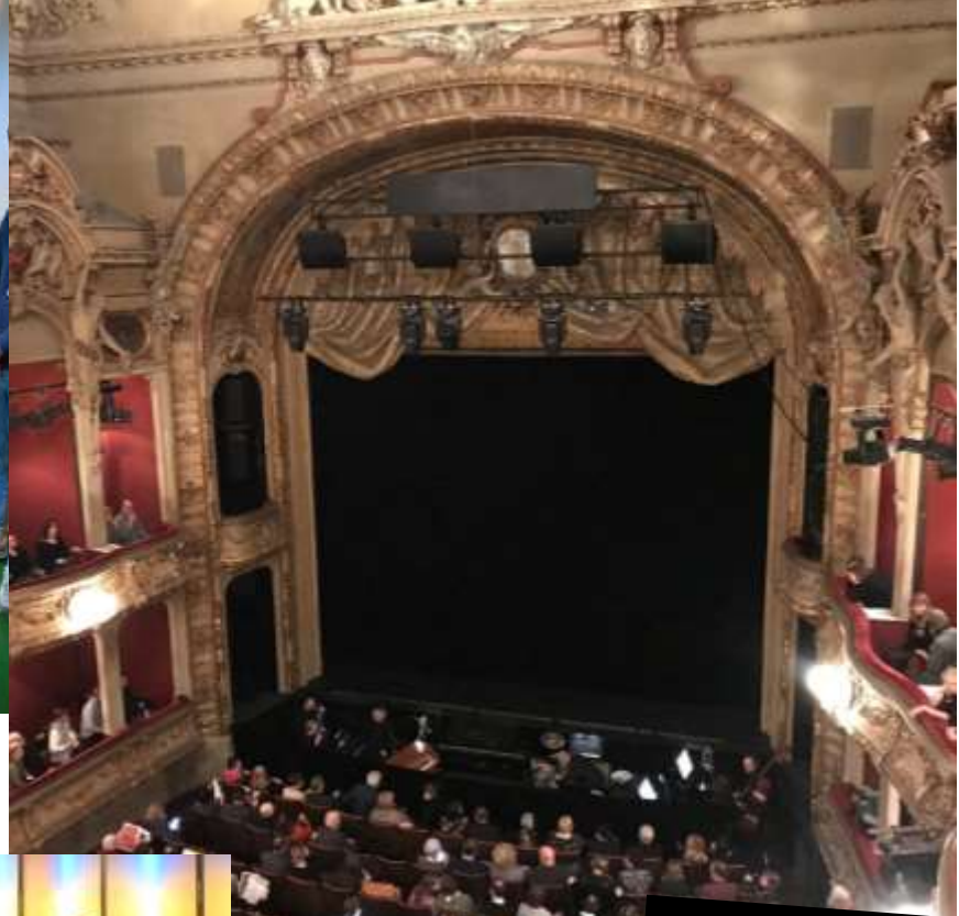
Dreigroschenoper, Berliner Ensemble