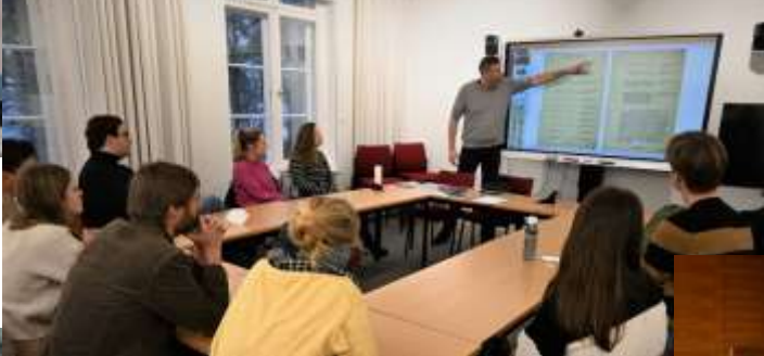
Haus der Wannseekonferenz (↑) Stasi-archieven (↓)